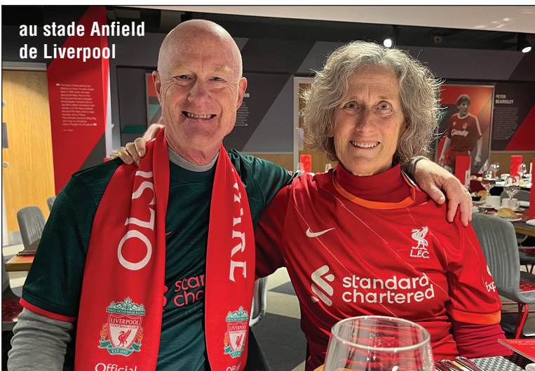
au stade Anfield de Liverpool